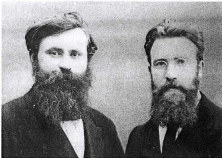
René De Clercq en Antoon Jacob.