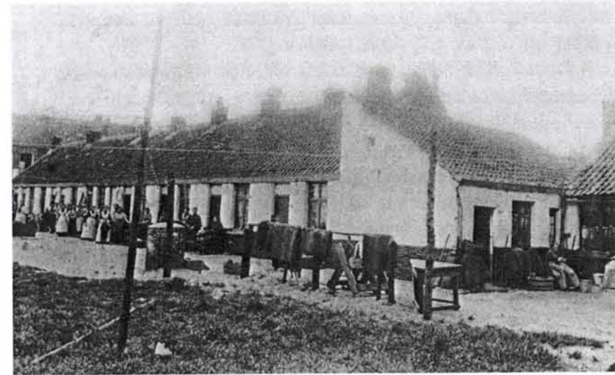
Gents beluik op het einde van 19de eeuw.