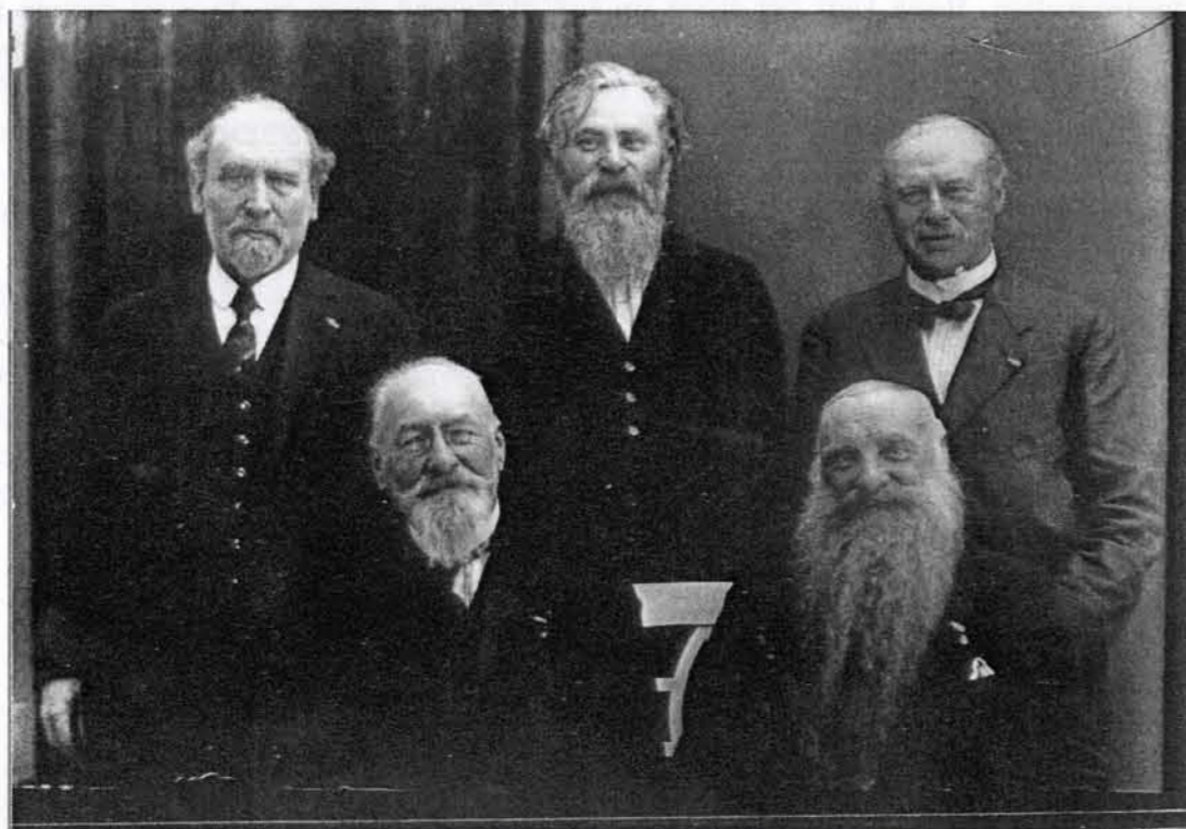
Belangrijke leiders van de Daensistische beweging.